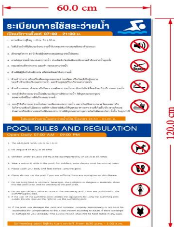
สติกเกอร์ติดคอกรีต หน้า 5 มิล เคลือบด้าน ขนาด 60x120 cm. จำนวน 1 ชิ้น

ดำเนินการสั่งทำป้ายกฎระเบียบสระว่ายน้ำ/Proceed to order signs for swimming pool regulations.